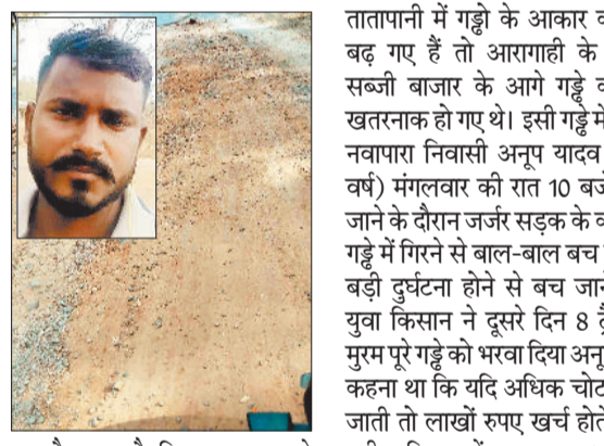
गौरतलब है कि बलरामपुर से रामानुजगंज के बीच राष्ट्रीय राजमार्ग 343 में बड़े-बड़े गड्डे हो गए हैं।