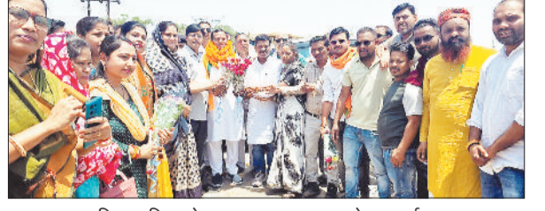
छग राज्य वन विकास निगम के अध्यक्ष का स्वागत करते भाजपाई।

पुलिस ने आरोपियों ने कोरिया जिले के विभिन्न स्थानों से 3 नग इयूक केटीएम, 1 नग आर-15, 2 नग स्कूटी, 1 नग सुपर स्पेंडर और 1 नग बजाज पल्सर एनएस 160 चोरी करने की बात कबूल की। पुलिस ने इन सभी बाइक को अलग-अलग ठिकानों से बरामद कर जब्त किया है। गौरतलब है कि बीते दिनों शहर के कचहरीपारा, स्कूलपारा, ओडगी नाका जैसे रिहायशी क्षेत्रों में हुई चोरी की घटनाएं सीसीटीवी कैमरों में रिकॉर्ड हुई थीं, जिसमें चोरों की गतिविधियां स्पष्ट रूप से देखी गईं। इन्हें फुटेज के आधार पर पुलिस ने आरोपियों की पहचान शेष पेज 4 पर