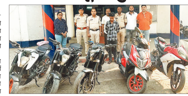
पुलिस गिरफ्त में आरोपी व जब की गई बाइक।