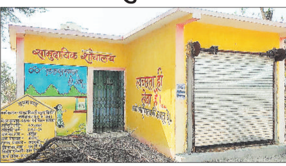
शौचालय में लगा ताला।

लाखों खर्च करने के बाद भी सामुदायिक शौचालय में ताला बंद है, वहीं इसके साथ ही बनाए गए दुकान की नीलामी भी नहीं की गई है, इसके कारण सामुदायिक शौचालय सह दुकान पंचायतों में शो पीस बनकर खड़ी है। बंद पड़े सामुदायिक शौचालय को चालू