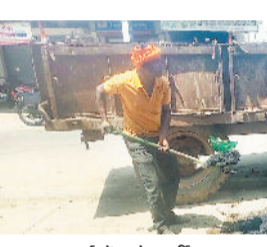
साफ-सफाई में जुटे कर्मी।

पटना। सुशासन तिहार के अंतर्गत प्राप्त जनशिकायतों के त्वरित निराकरण की दिशा में नगर पंचायत पटना द्वारा प्रभावी कार्य उठाए जा रहे हैं। वाई क्रमांक 15 में साफ-सफाई नहीं होने की शिकायत मिलने पर प्रशासन ने तत्पश्चात दिखाते हुए तत्काल कार्रवाई की। प्राप्त जानकारी के अनुसार वाई 15 में गंदगी और जाम नाली को लेकर नागरिकों द्वारा आवेदन प्रस्तुत किया गया था। इस शिकायत को गंभीरता से लेते हुए संबंधित अधिकारियों ने मोके पर पहुंचकर सफाई व्यवस्था दुरुस्त करवाई। सफाई कर्मचारियों द्वारा कचरे को सफाई के साथ-साथ नाली में जमे मलबे को भी हटाया गया, जिससे जल निकासी में आ रही समस्या का समाधान हो सका। नगर पंचायत पटना के सफाई कर्मचारियों द्वारा त्वरित कार्रवाई किए जाने से स्थानीय नागरिकों, विशेषकर शिकायतकर्ता को राहत मिली है, इससे क्षेत्र में स्वच्छता और स्वास्थ्य की स्थिति बेहतर होगी।