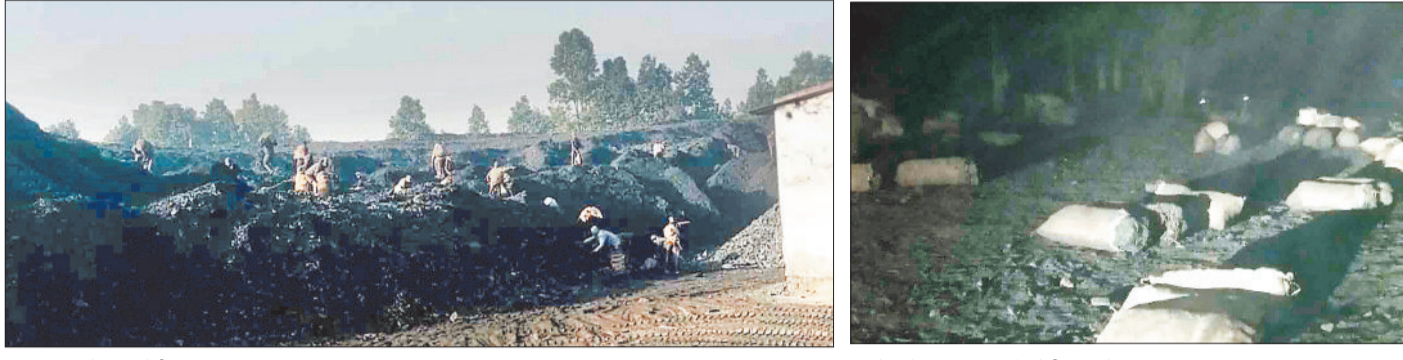
खदान से कोयला चोरी करते लोग।