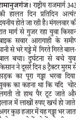
गौरतलब है कि बलरामपुर से रामानुजगंज के बीच राष्ट्रीय राजमार्ग 343 में बड़े-बड़े गड्डे हो गए हैं।